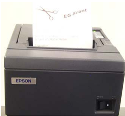
Lyn hurtig bon med grafisk logo

erhvervs-gruppen, danmark a/s Erhvervsvej 10, Knudlund Øst 8653 Them