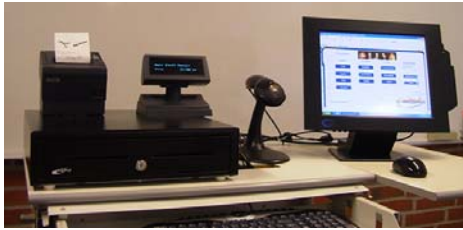
Touch skærm, kunde display, bon printer stregkodelæser, kasseskuffe